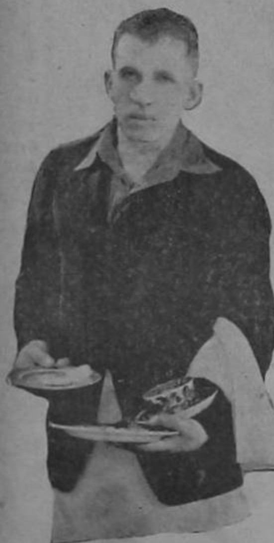
El simpático Oficial Mayor de la Secretaría de Salubridad.