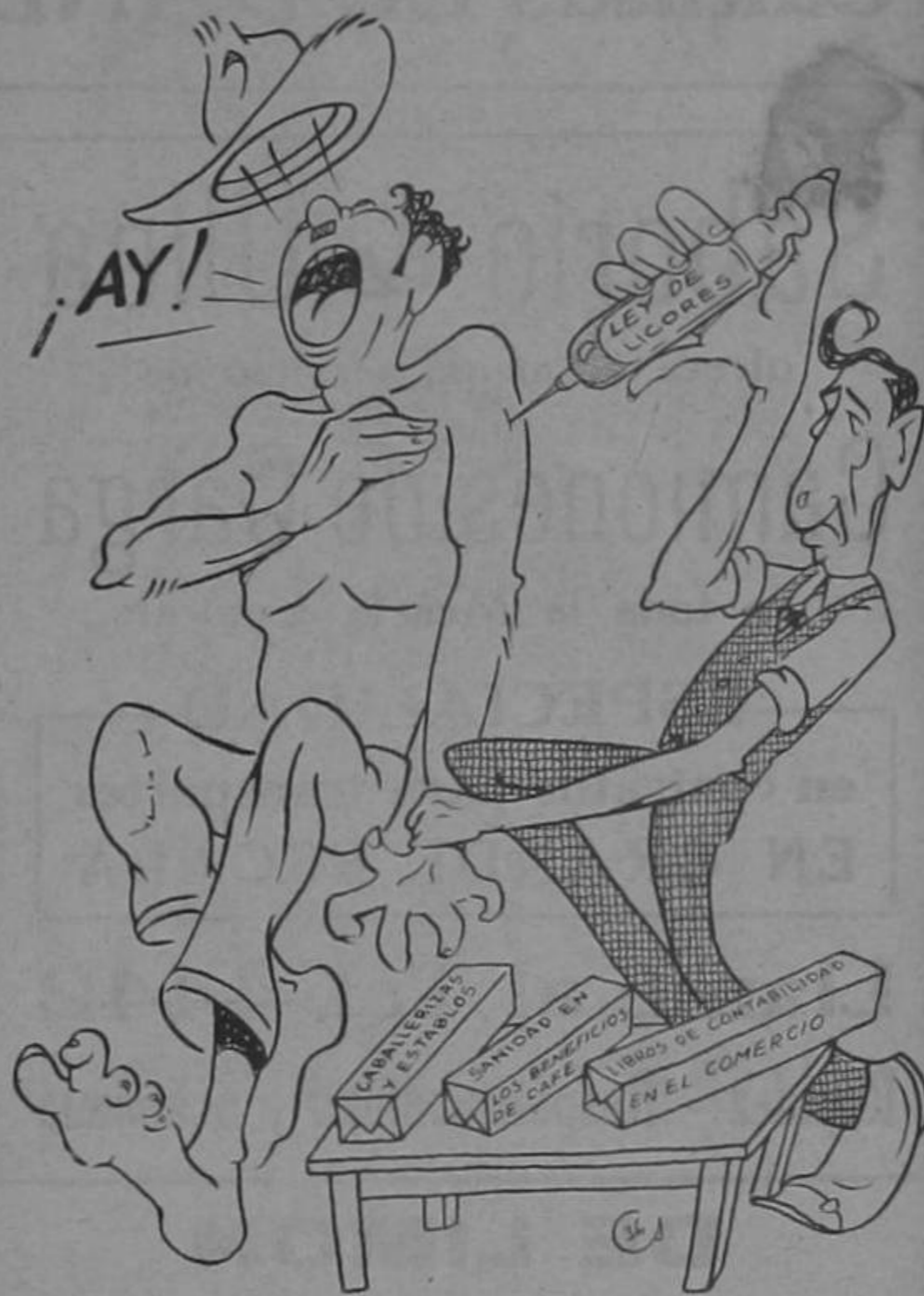
Don León: —No grites antes de tiempo, que aún te faltan estas y muchas otras para quedar O. K.!!!