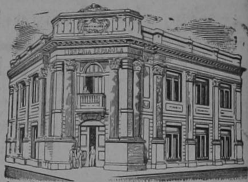
LA LIBRERIA ESPAÑOLA