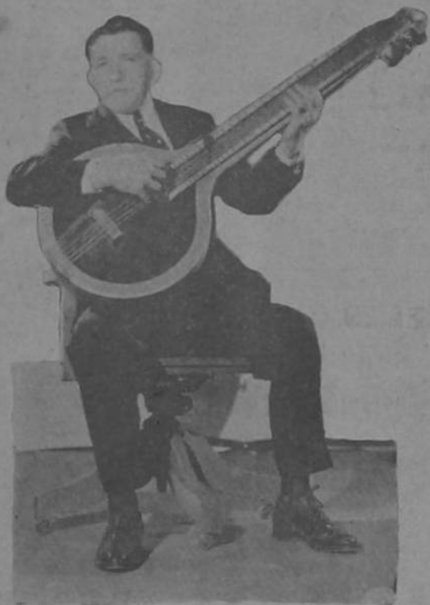
UNO QUE ESTA TOCANDO EL VIOLON