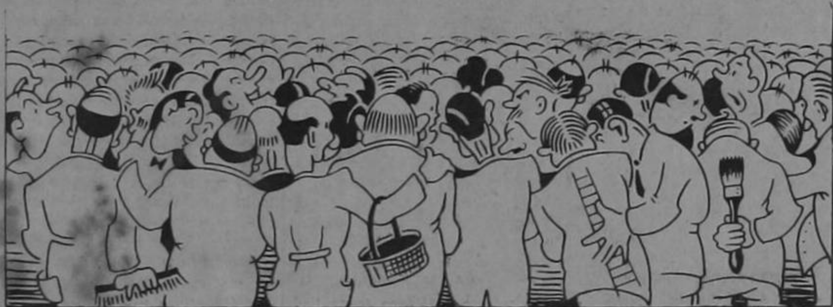
Vista panorámica de una reunión de señores de las familias Cortés - Fernández. Todos están empleados en el Gobierno. (Esto es sobreentendido). Algunos valen por dos y faltan muchos más.