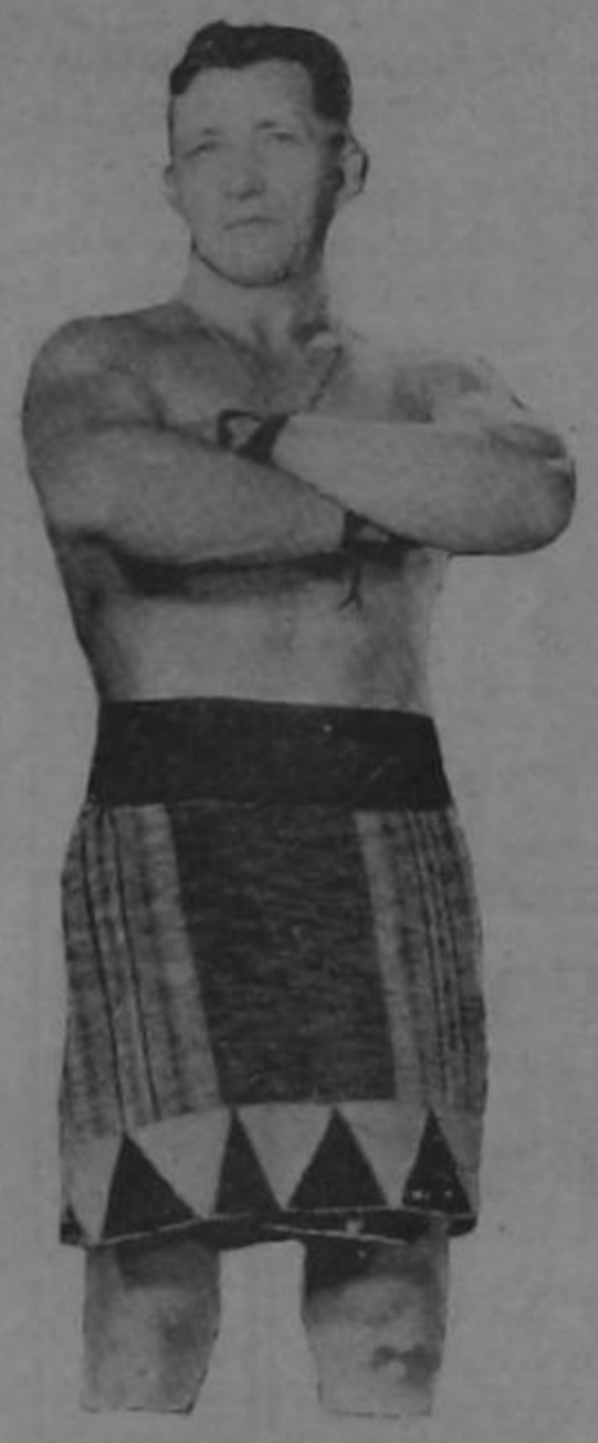
Esta es la fotografía del hombre Fuerte a quien durante la pasada campaña política vimos destacarse con líneas vigorosas.

Curiosa visión óptica La produce la misma fotografía