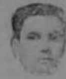
El Príncipe Otto

Y finalmente que no crean nuestros amigos que al llamar corrongo a este gobierno hemos entrado en la venerable cofradía de las brochas.