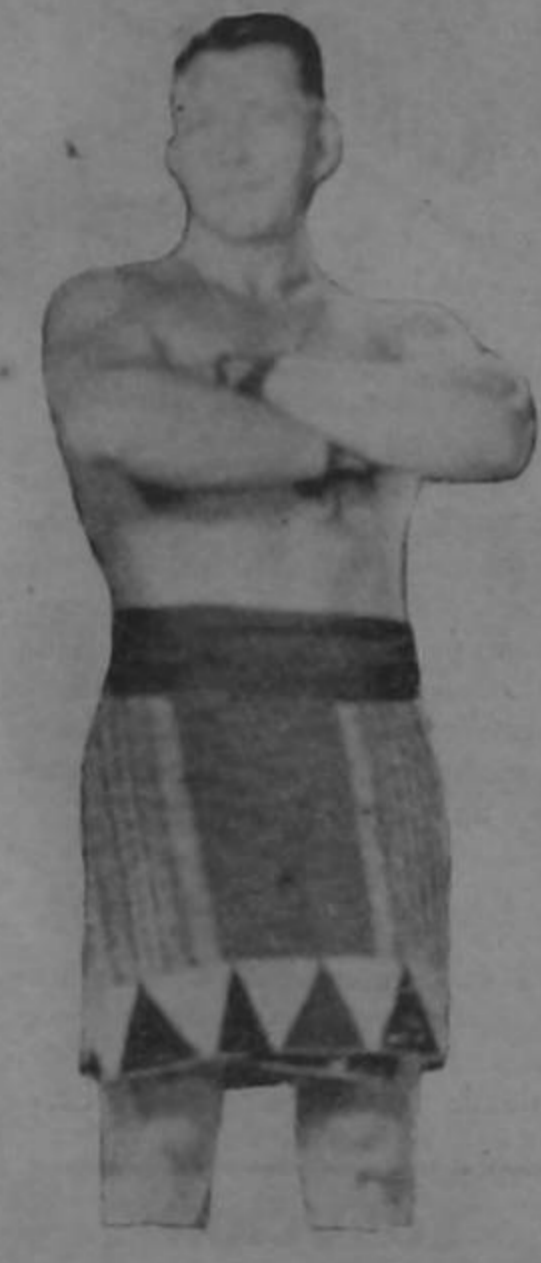
Y El Hombre Fuerte. Es igual al otro. Es el mismo pero lo vemos que se va esfumando. Cuestión de óptica!