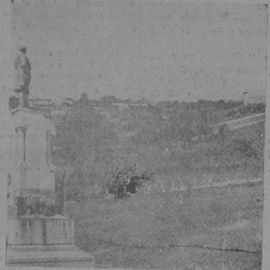
A como han venido las cosas Mora, veremos en el fondo un poquito en el correo, en 1940, al retratar la estatua de don Juan Rafael