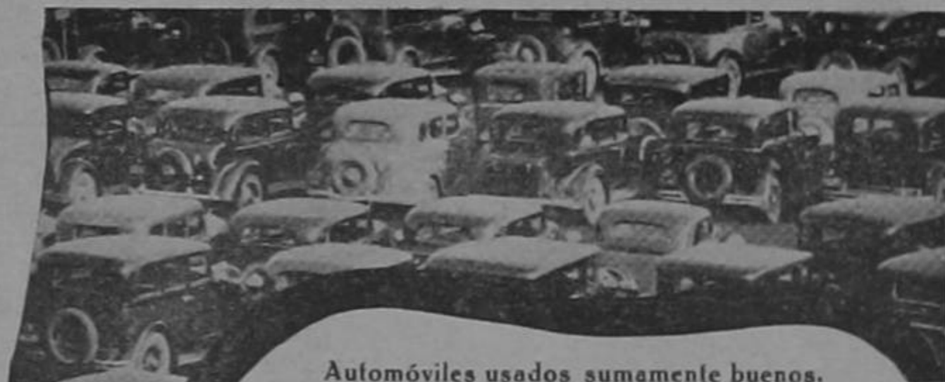
Automóviles usados sumamente buenos, baratísimos, PERO AL CONTADO.