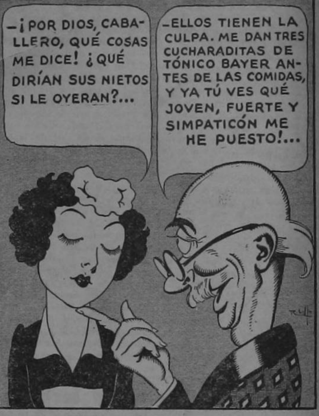
DIALOGO DE AMIGOS