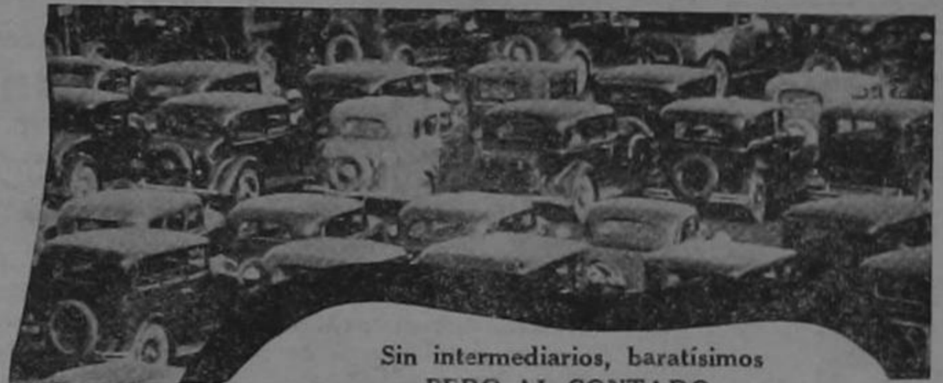
Sin intermediarios, baratísimos PERO AL CONTADO

SAN RAMON (casi de noche).— Se ha desmentido de una manera rotunda el robo del Océano Atlántico. Según se asegura, dicho mar no ha estado jamás en San Ramon ni de excursión, mucho menos establecido. Por lo tanto, no ha podido ser robado en esta localidad. También se afir-