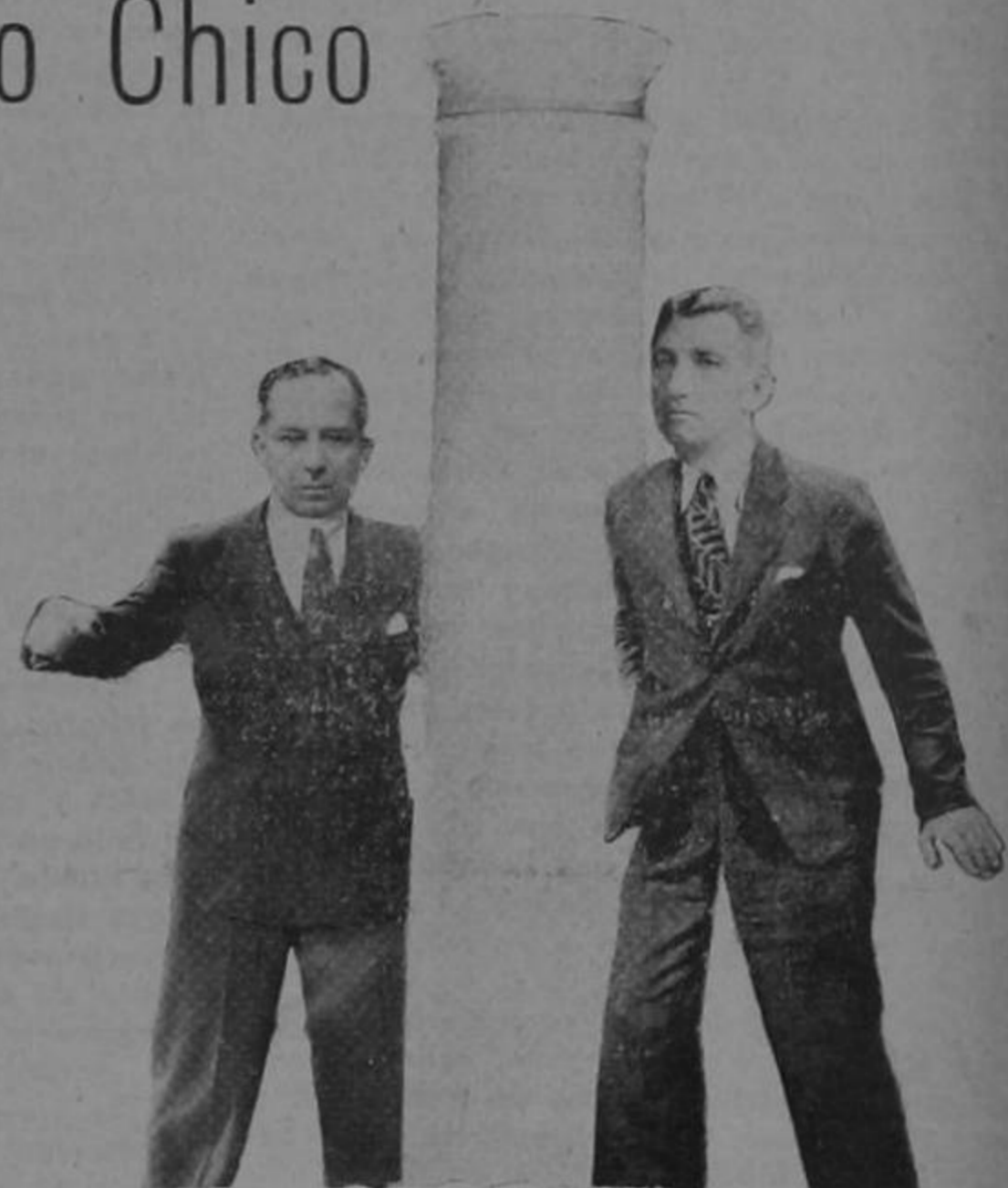
Por problema engorroso cuentan que un jueves tres, Balta llamó mentiroso a un Presidente muy "Cortés".