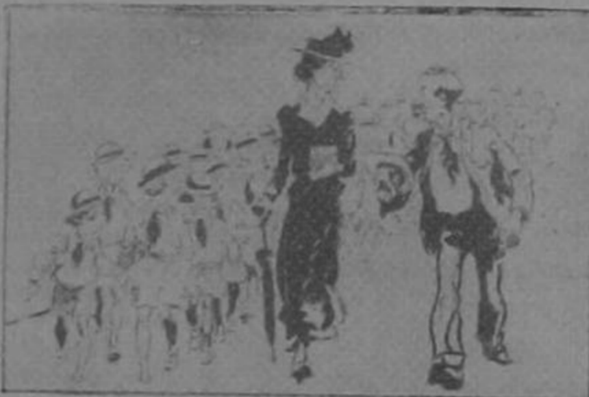
La felicito, señora. Mi vieja tuvo doce y era la admiración del pueblo...