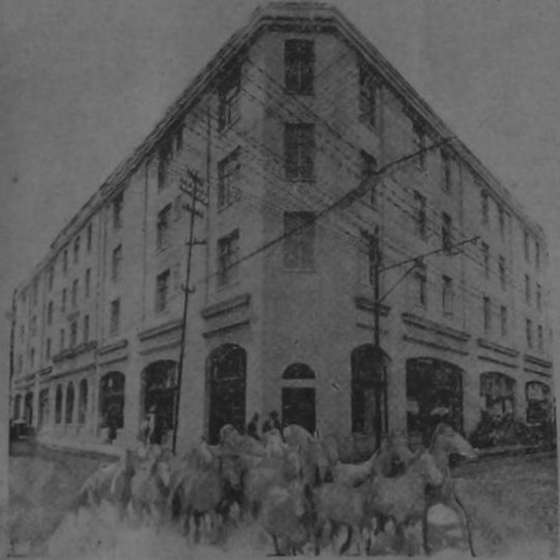
LOS CABALLOS: Corramos antes de que nos metan en la refrigeradora.