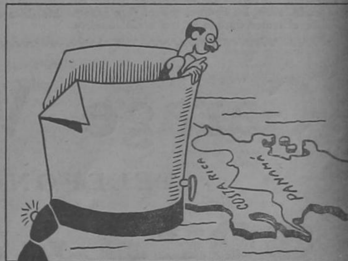
El susto del Canciller