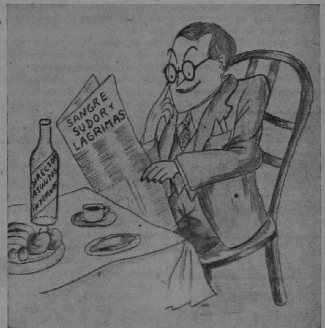
¡Qué pensarán los hombres, oh Dios, lo que es un internacionalista...!