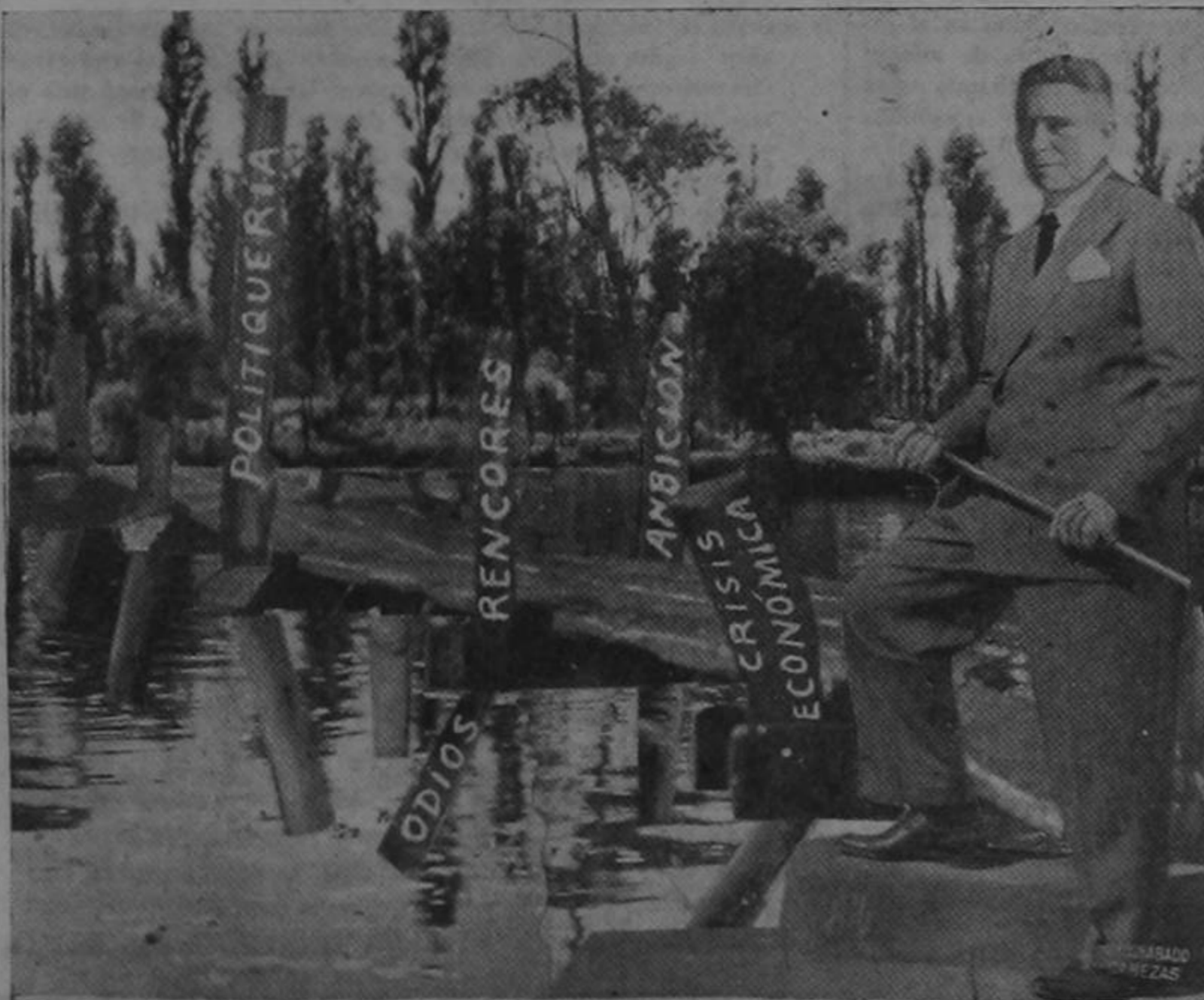
ULATE:— La verdad es que una cosa es verla venir, y otra hablar con ella...

Ante los ojos del Presidente Electo se presentan muy graves problemas. Es muy difícil el puente que tiene que atravesar. (Dice un periódico).