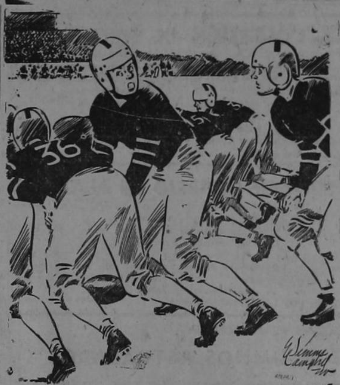
—Recuerda que estamos en Guatemala, y que aquí hay que perder, o perdemos el físico.