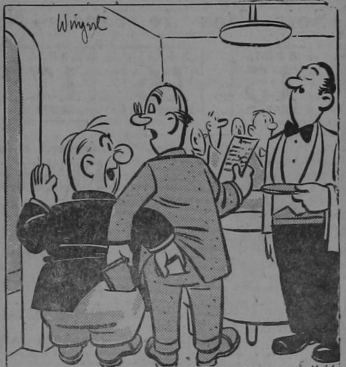
—De ninguna manera, la cuenta es mía...