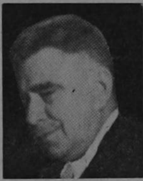
Llegan sus antiguos compañeros de lucha...