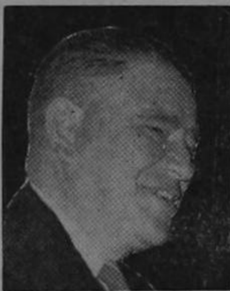
Llega don Pepe Figueres.