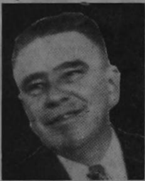
Llegan los señores diputados...