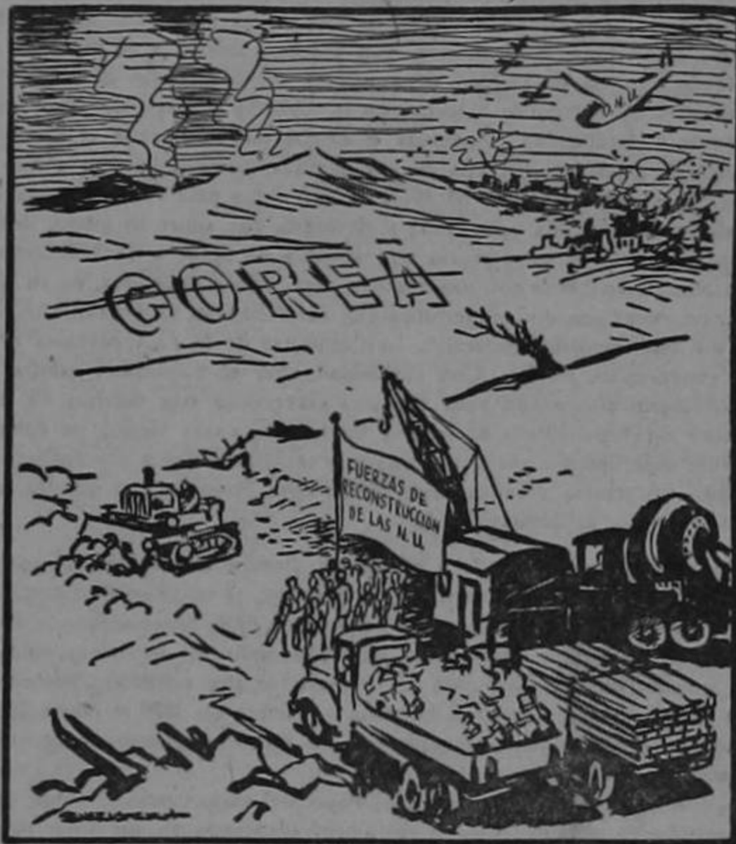
DEL DIARIO "THE SAN FRANCISCO CHRONICLE", DE SAN FRANCISCO, E.E.U.U.

Así trata el comunismo internacional de impedir que "la voz del mundo libre" penetre detrás de la Cortina de Hierro para llevar el credo de libertad a los pueblos que viven bajo la sumisión soviética. Pero es en cavo: porque la voz del mundo libre penetra más allá de las murallas con que los dictadores quieren atajarla.