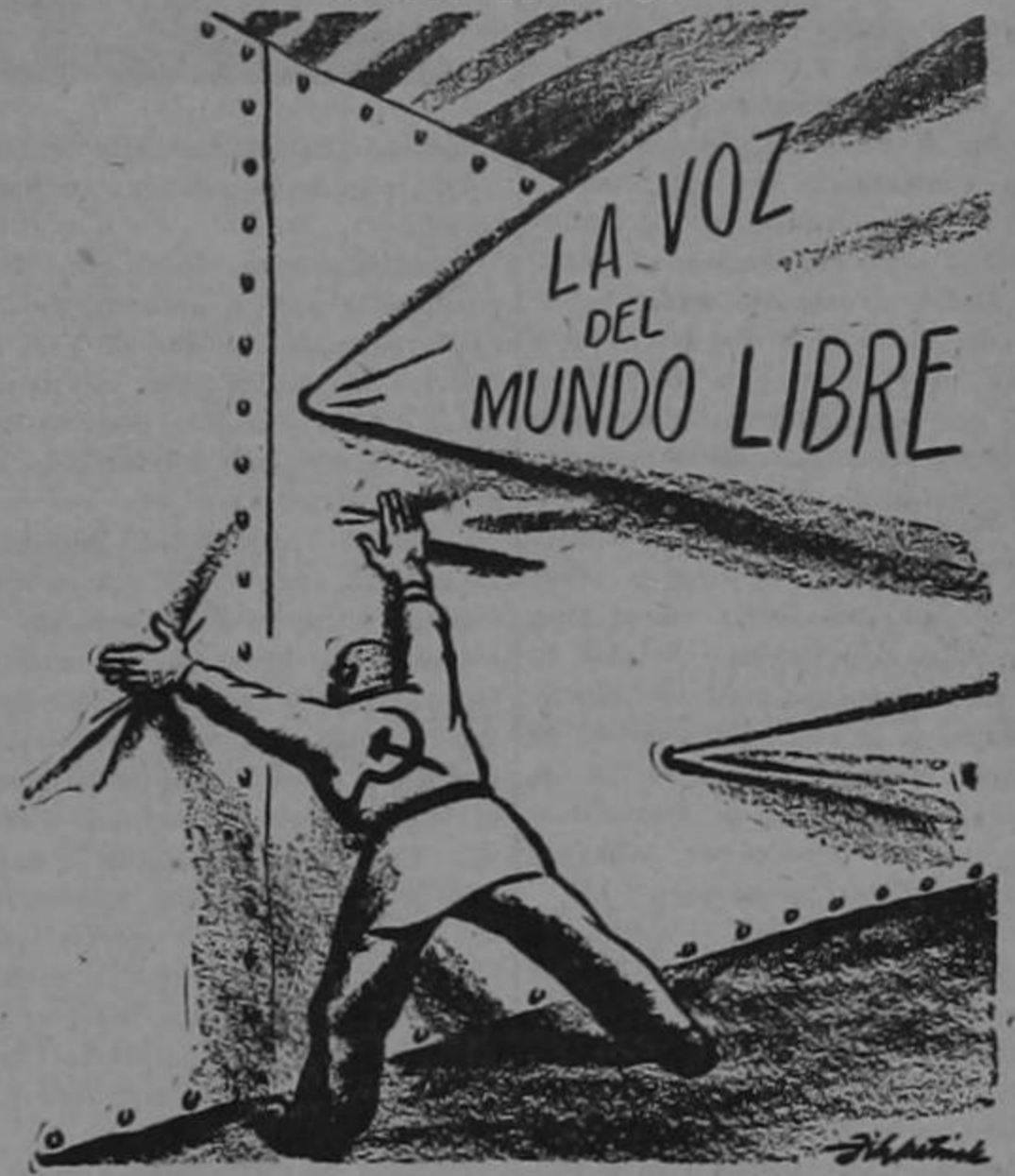
DEL DIARIO "THE SAINT LOUIS POST-DISPATCH", DE ST. LOUIS, E.U.A.

"NO SE PUEDE ENGAÑAR CONSTANTEMENTE A TODO EL MUNDO"