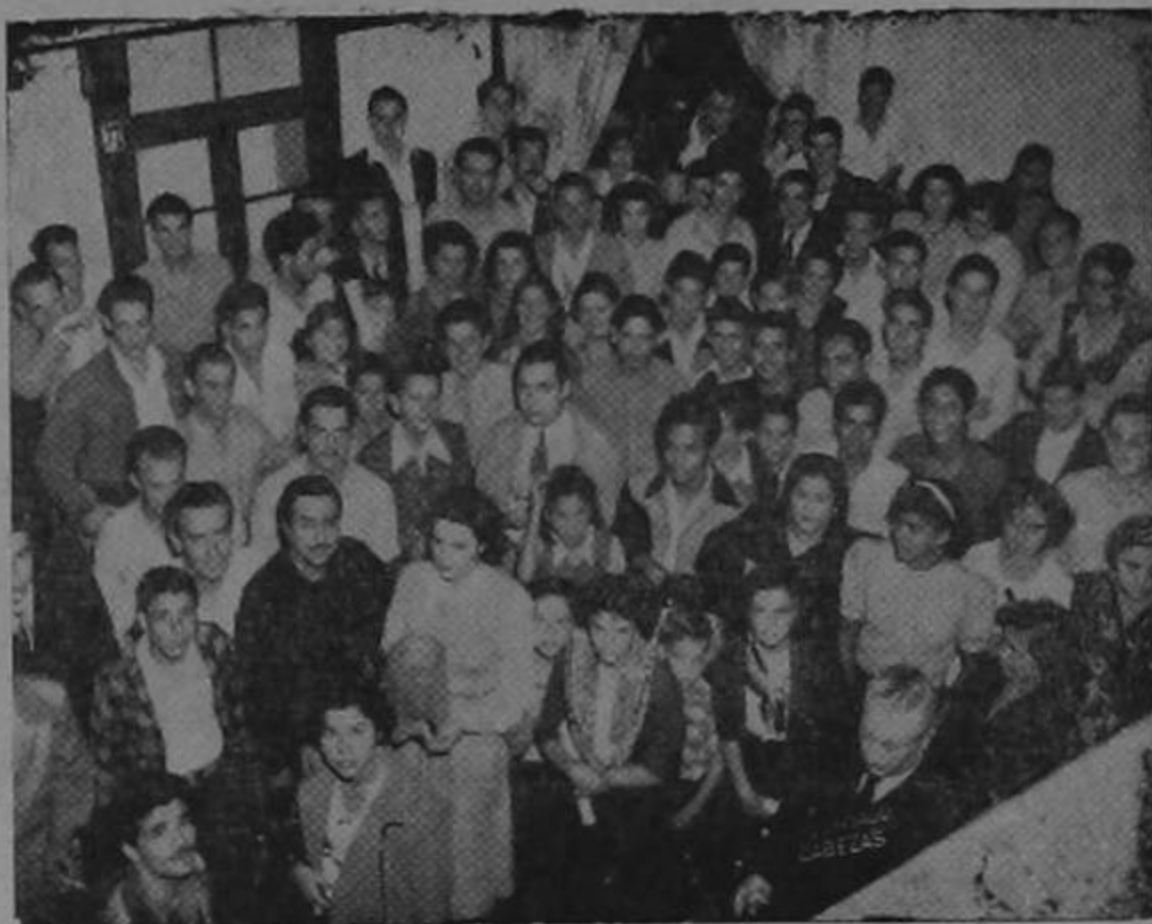
En este grupo figuran muchas personas beneficiadas con premios.

Una misteriosa y gentil señorita abonada a las transmisiones que hace la popular y muy gustada estación "La Voz de América", nos llamó por teléfono hace pocos días. Nos dijo que ella deseaba que participáramos en el Concurso Deportes Traube que transmite diariamente "La Voz de América" y "Radio Crystal". Esto es, el programa que con tanto acierto orga-