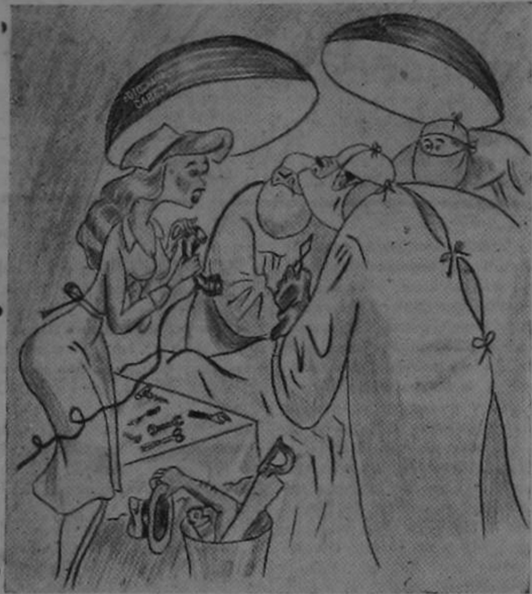
De "Pobre Diablo"