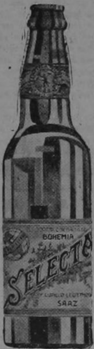
Es un producto "TRAUBE"

Y, con la más cálida indignación, el caballero colgó el teléfono, dejándola a su interlocutora sumida en profundas cavilaciones.