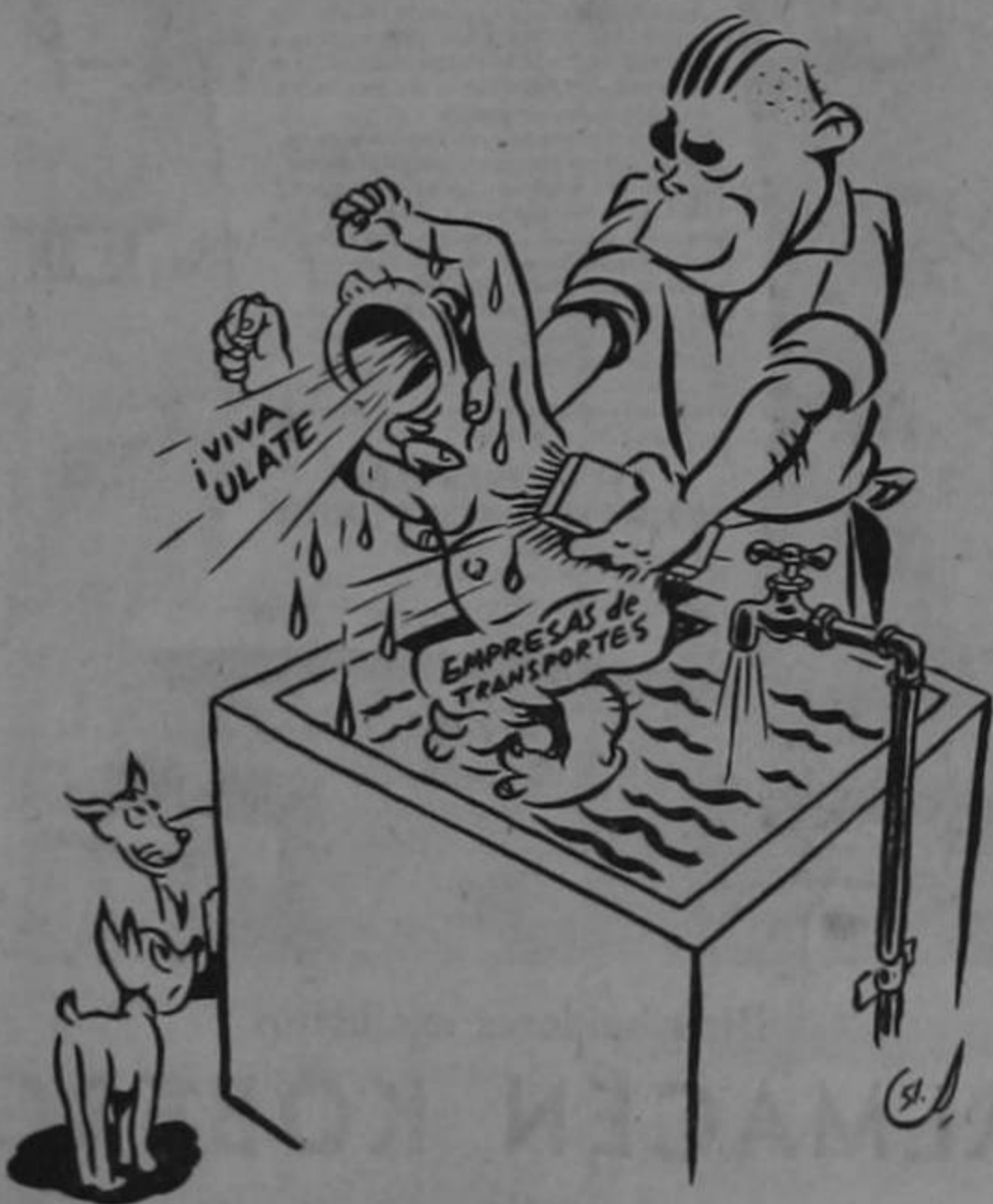
Quien por su gusto muere, aunque lo entierren parado...

"Ni alza de tarifas, ni recargo de pasajes"