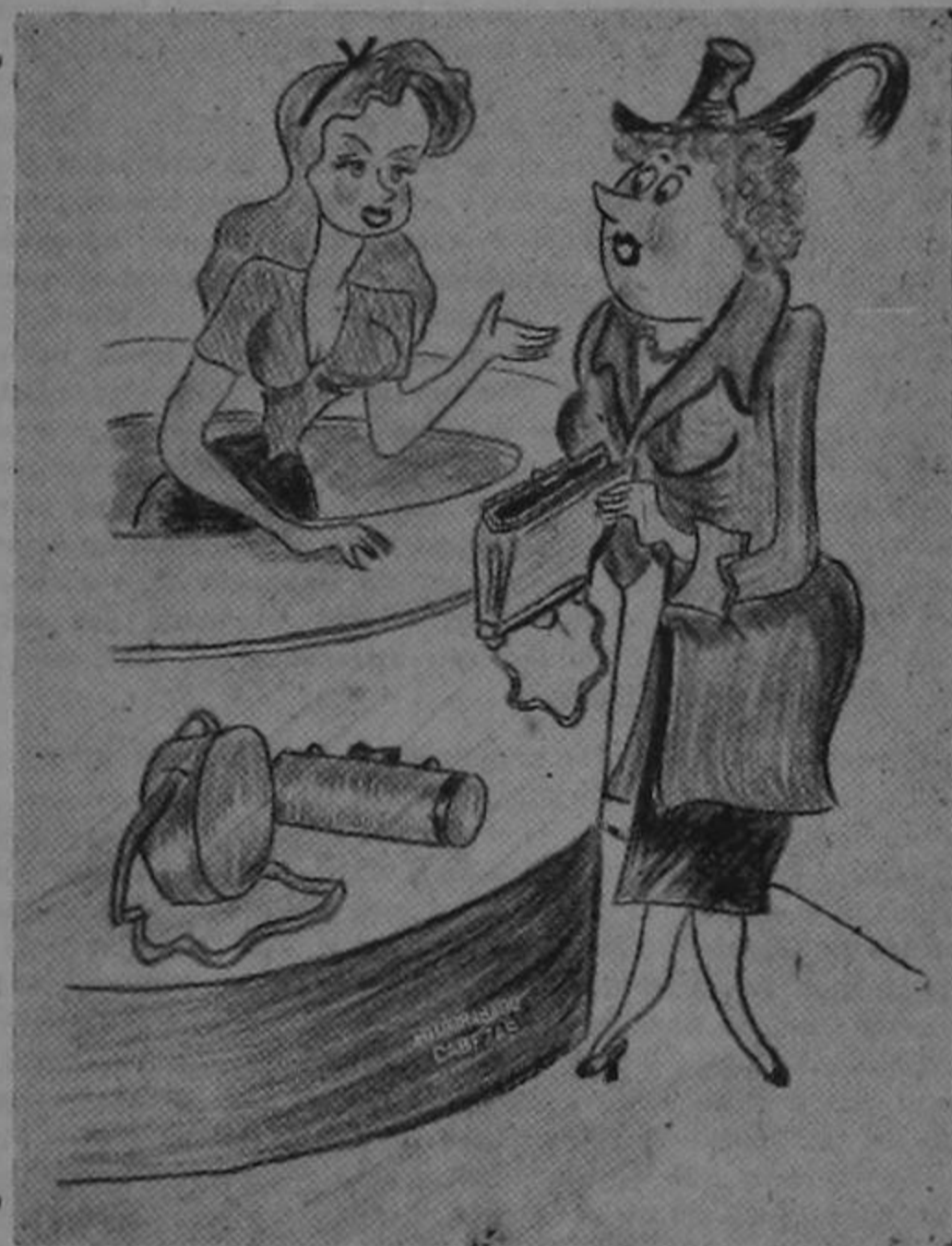
De "Pobre Diablo"

dijimos antes, no se dice: "Se autoriza al Poder Ejecutivo para que —Pasa a la Pág. 5. Nº 1