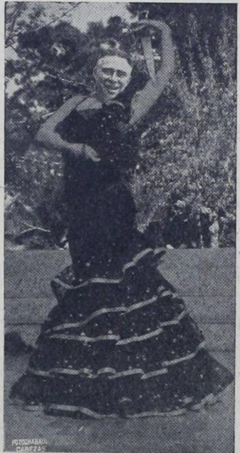
(Con música de la canción "Lola Puñales").

(Declara el Presidente Ulate que el Tribunal Supremo es la más alta autoridad en materia electoral. Sus funciones como gobernante se reducen a velar por el mantenimiento de la ley. En consecuencia no puede intervenir en el revolcón político que se ha formado).