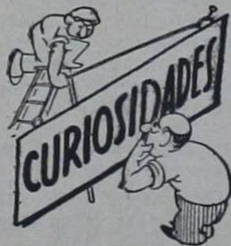
NO HAY PIERNAS FEAS

Los que están quemándose para que la Constitución se