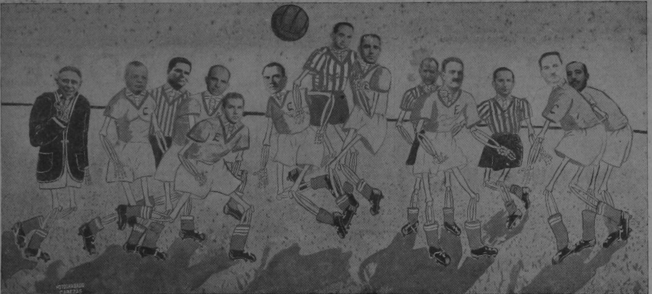
UN JUGADOR RETIRADO SERA EL REFEREE