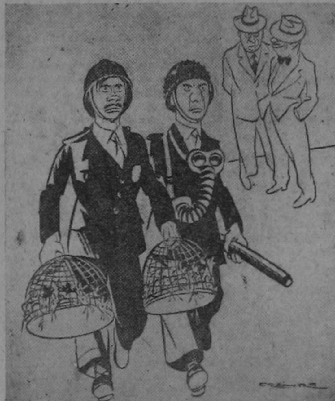
La foto muestra al Coronel Castillo Armas con otro oficial no identificado, marchando por las calles de Esquipulas. El Jefe de la revuelta lleva dos jaulas repletas de ratoncitos para bombardear con ellas las posiciones gobiernistas. Todo sirve en la revolución chapina. Se han empleado hasta panales de quitacalzón y hormigas agrias.

(Servicio de telefoto especial para LA SEMANA COMICA).