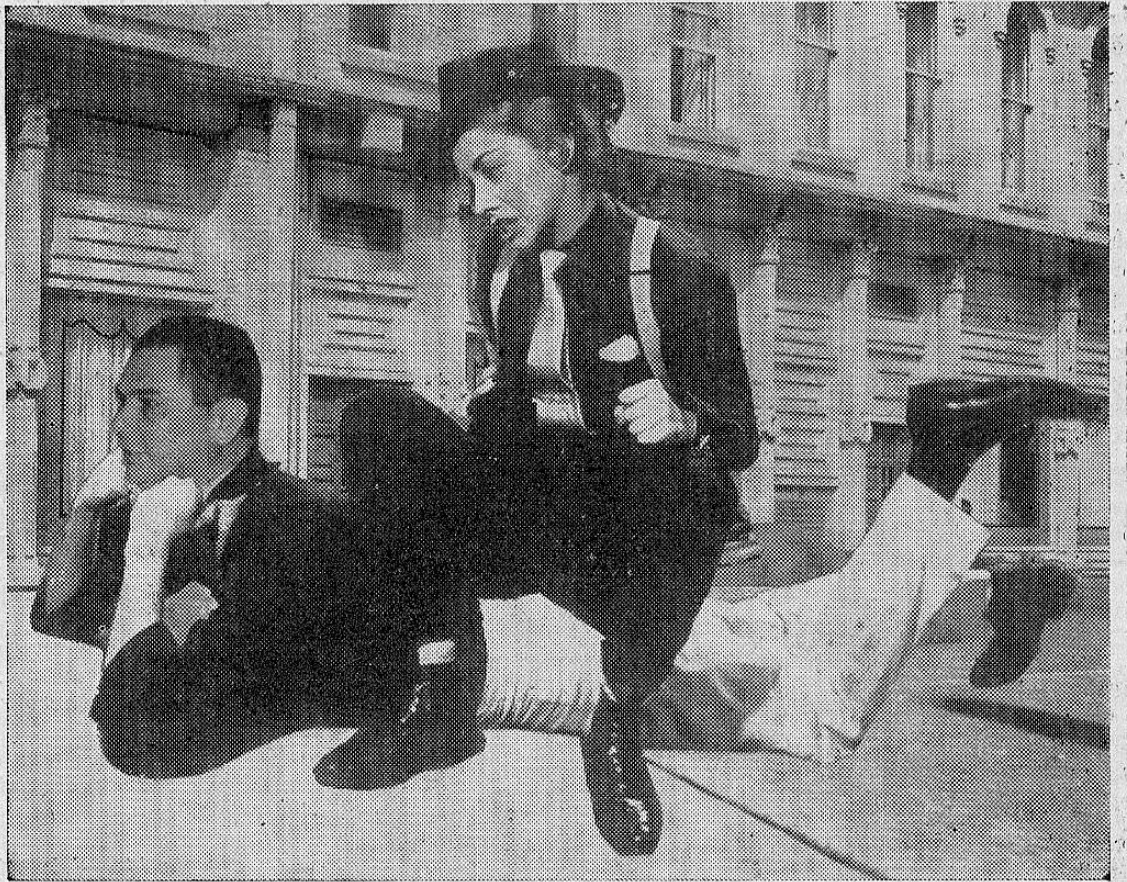
DON ALFREDO: —Ya esta vieja me está jorobando mucho...

Declara el diputado Volio que hay crisis de gabinete, y que se va el Ministro de Hacienda. Fuentes oficiales desautorizan esa noticia.