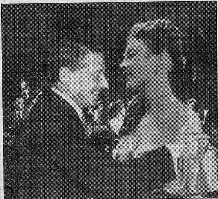
Don Manuel dice que está al margen de la política. ¡Y con lo que le gusta!... Hay que recordar que el hombre es reincidente...