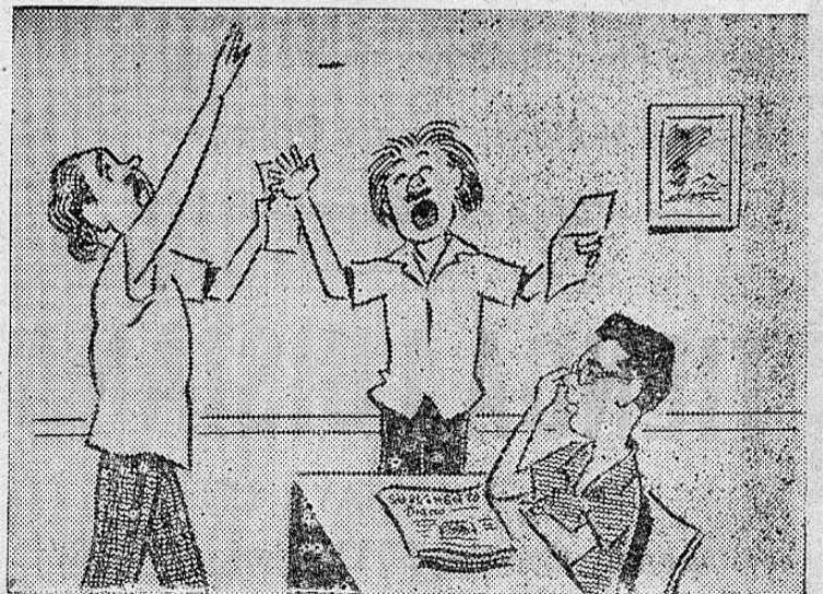
—Dame una idea de lo que es atraco... —El contrato de teléfonos que quieren los italianos...