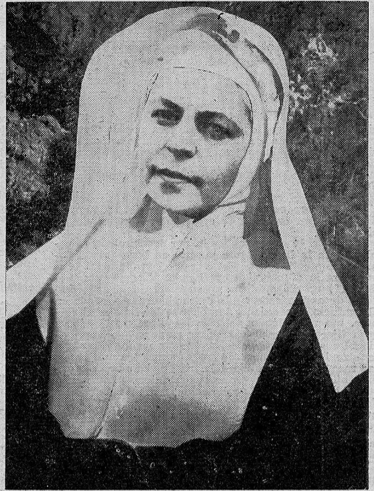
SOR QUETELA: —Lo único que les ha faltado es decir que soy "Atalaya"...