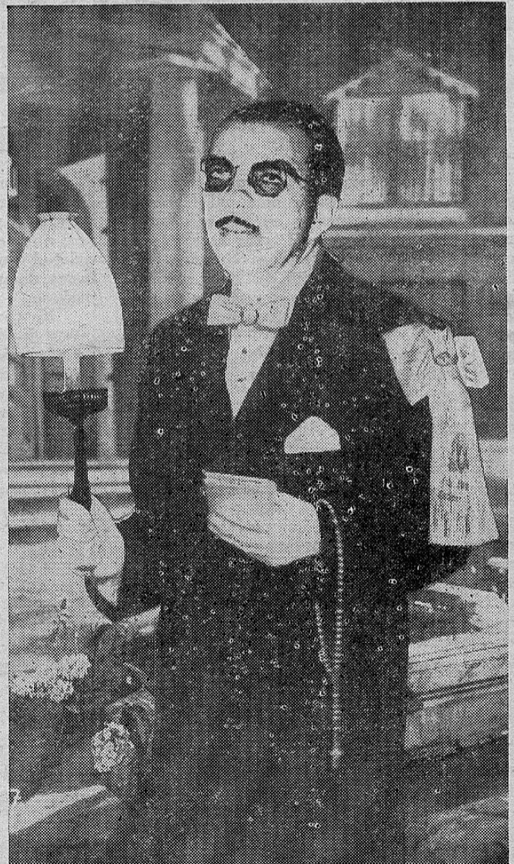
¿El Decano o el Rey Feo?