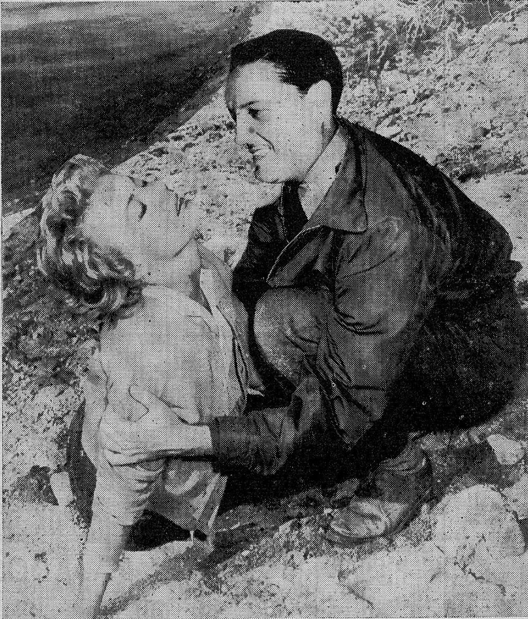
EL: —Y ahora, vete de aquí; soy casado. ¡Vete, vete...!