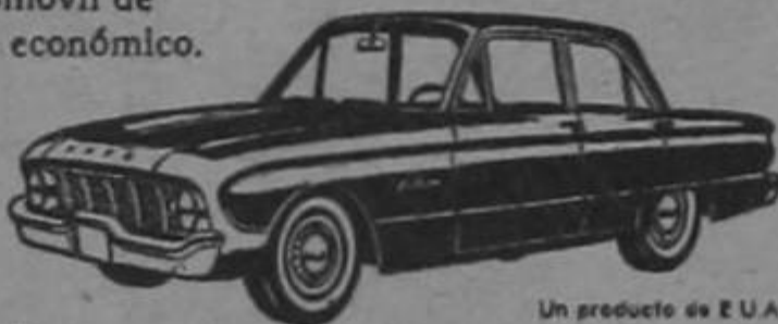
Un producto de E.U.A.

Véalo hoy mismo en el salón de su concesionario Ford.