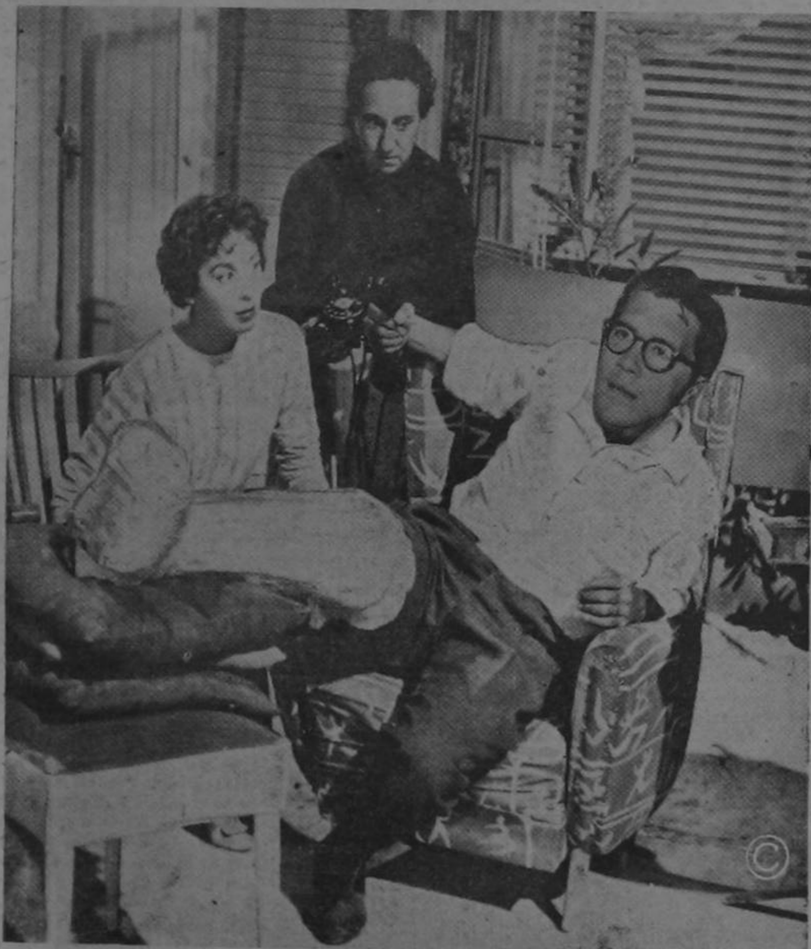
EL MINISTERIO DE GOBERNACION