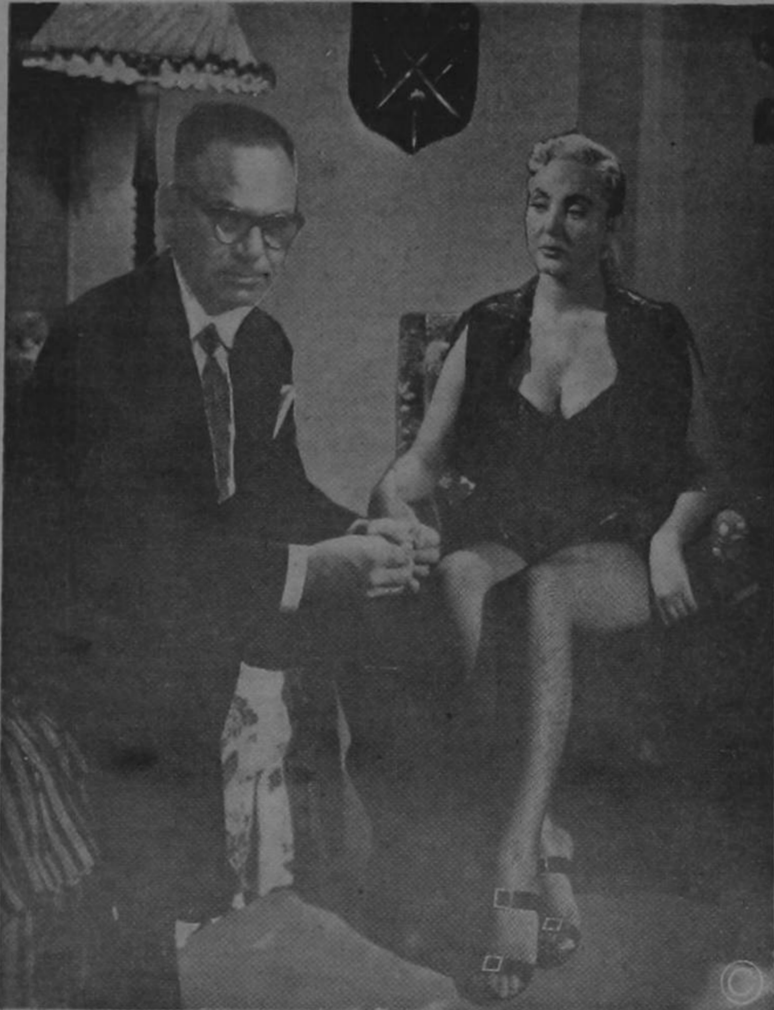
EL: — No veo el motivo para que mi nombramiento les haya caído como un purgante de sal de Inglaterra con hojas de sen y con guaro alemán... ELLA: — ¡Remember, machito, remeber...!