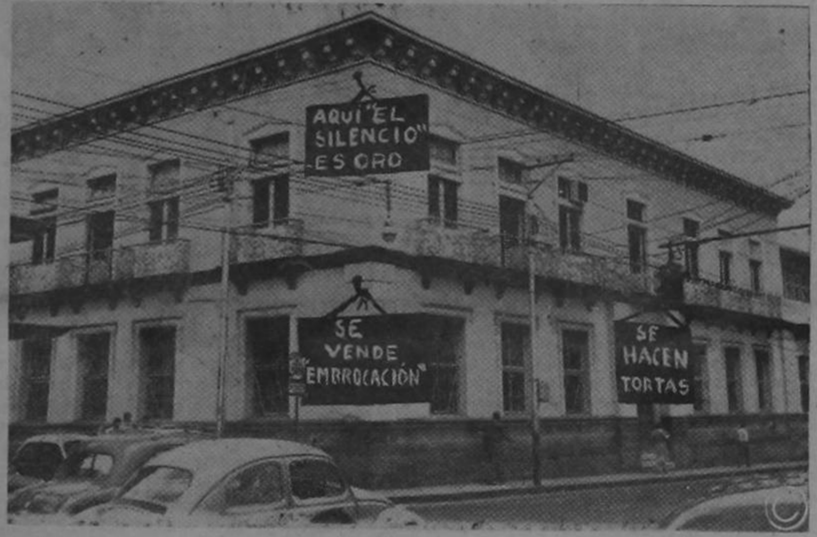
Cualquier parecido con el Banco de Costa Rica, es mera coincidencia...