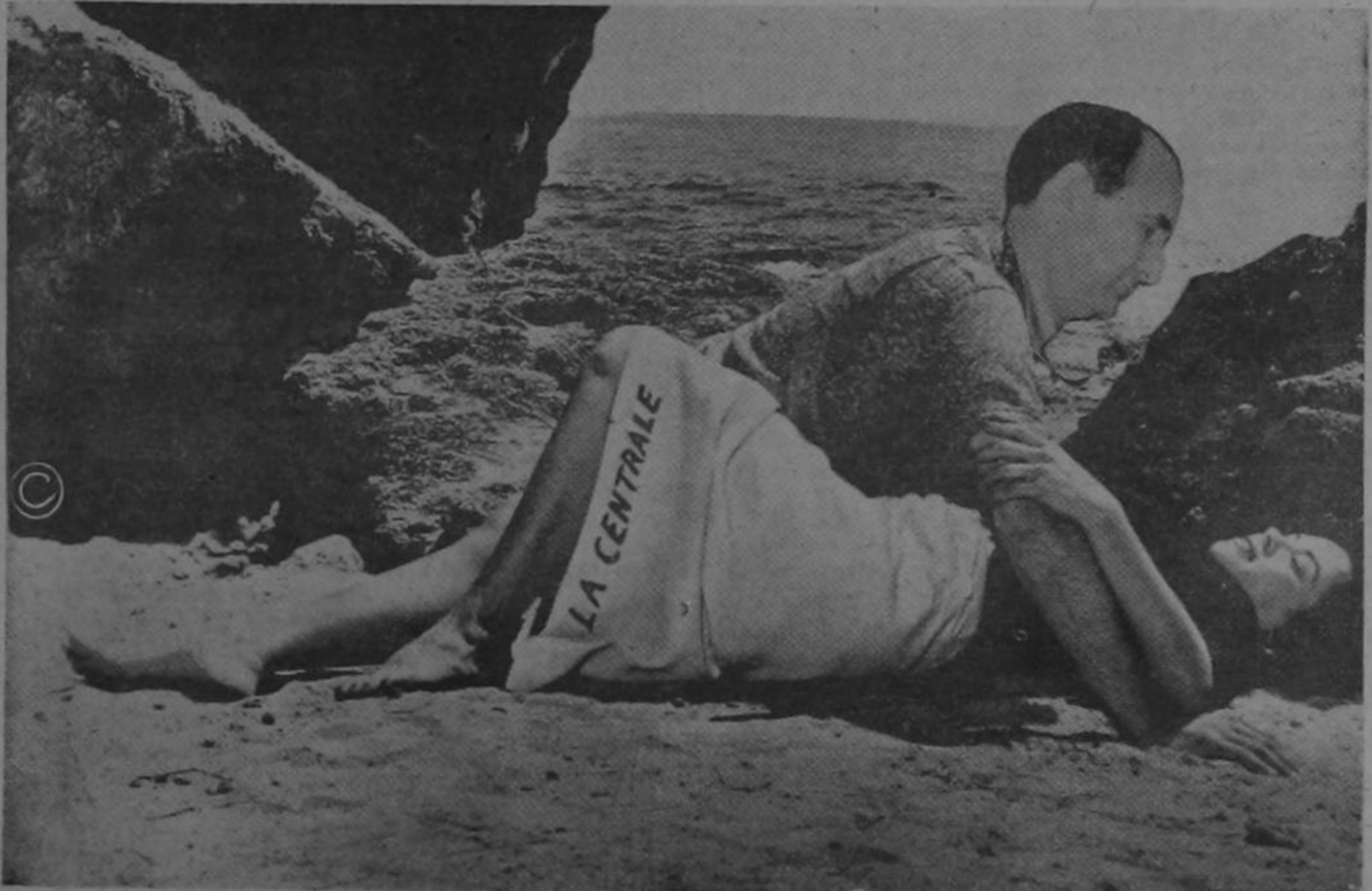
ELLA: Gracias. Pipeto moltras gratias, me has salvato...! Masoy molto disgraciata en los míos amores! ¡El Prechideate me mira con feroche intenzione! Tengo pavura...!

(Allá parlaremos de algún negocino, y, ya está interato, vamos al serruchinol. Vale.