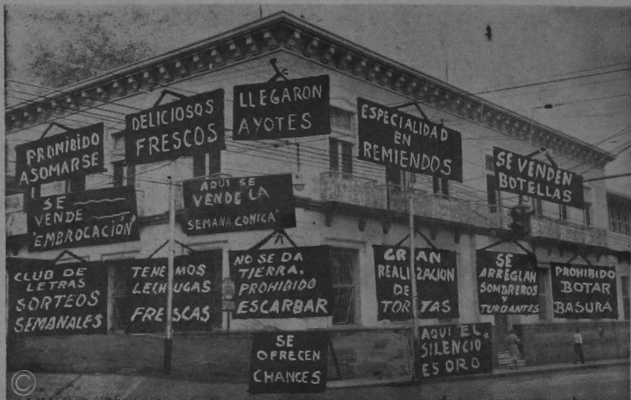
(Cualquier parecido con el Banco de Costa Rica, no es mera coincidencia...)

No hay derecho a que las gentes, en forma indebida, sin permiso alguno, coloquen letreros y avisos en la propiedad ajena. De este modo cualquier día veremos un espectáculo como éste.