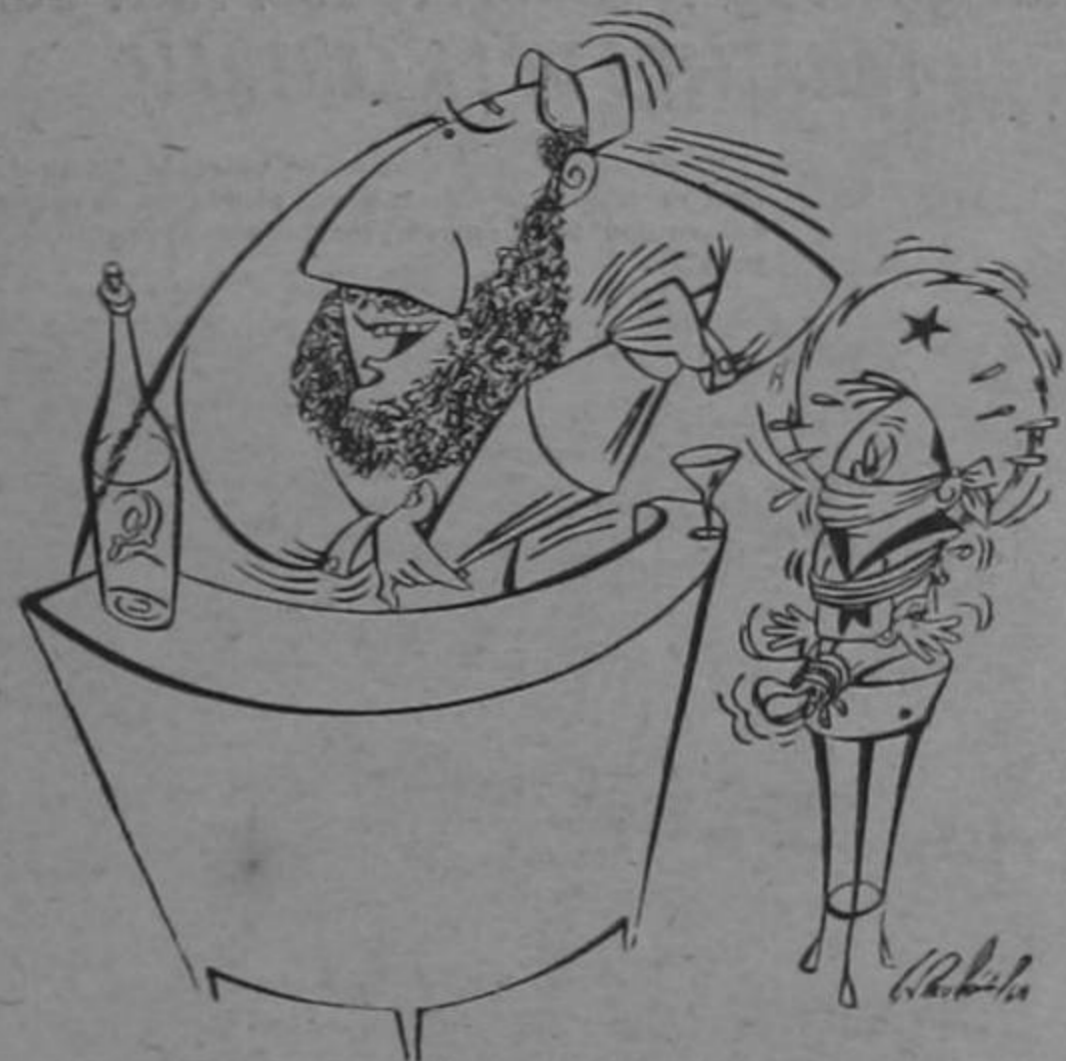
'CUBA LIBRE' ... CON VOOKA