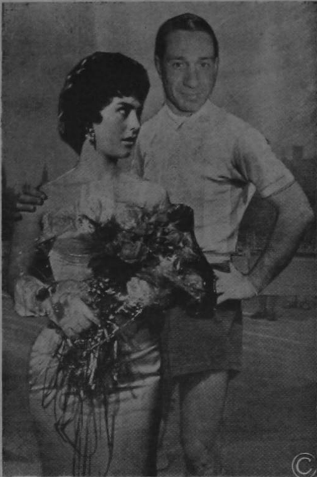
ELLA: —Pierto, centrale bien... EL: — ¡Eh per la Santa Madona! ¿por qué no han colocato al INCE de porterino?

Mientras Echandi, que no se ve en la fotografía, está en la puerta listo a parar el punteo, el capitán del equipo La Centrale, se prepara para tirar el penalty.