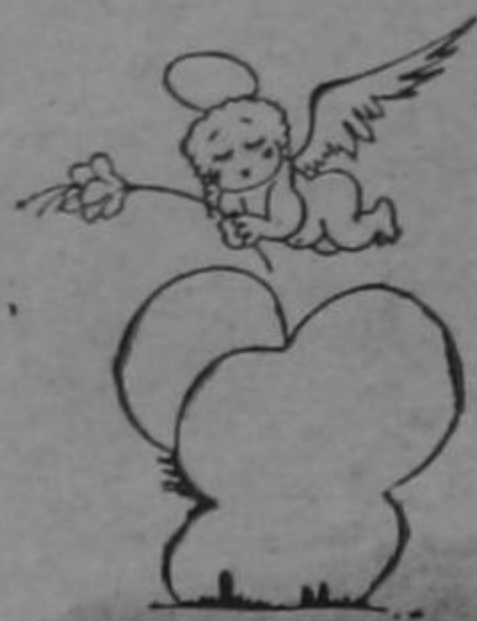
Así dice Papá Méndez.