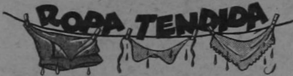
(Por el Vizconde Rubio)

DIA 31—San Ramón non-nato. Patrón de don Jorge Carazo, Ministro non-nato de Industrias. Estamos invitados al rosario que va a celebrarse con derroche de bombetas, ron colorado, tamales, manjares y bizcocho. La fiesta es de contribución.