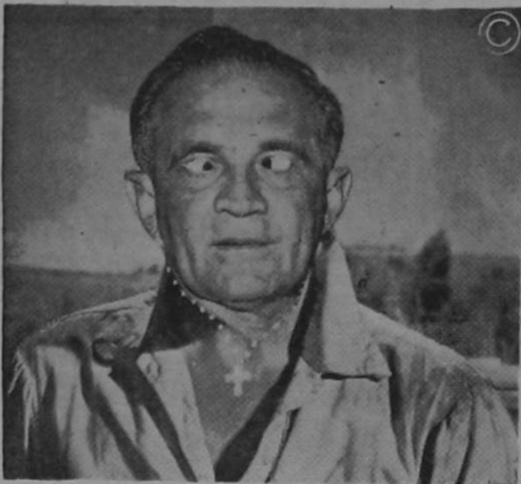
ARCAÑA — La política en Venezuela la veo muy nublada...