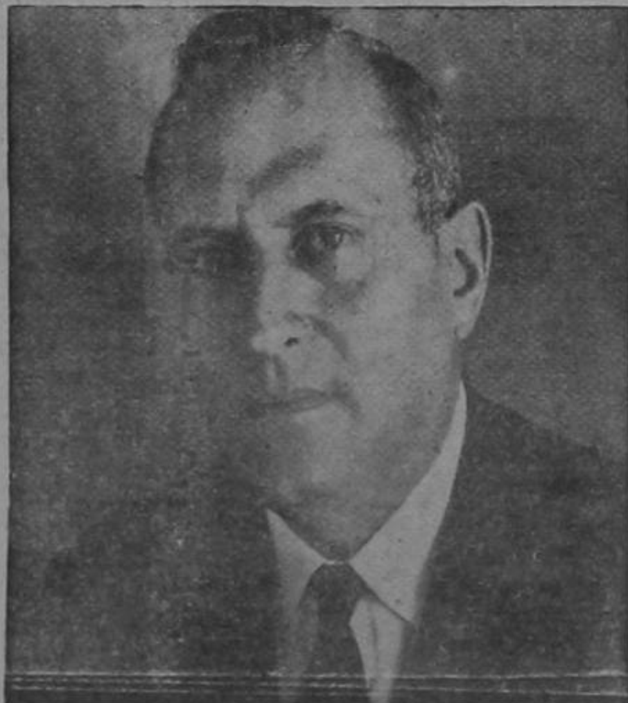
Doctor CALDERON GUARDIA