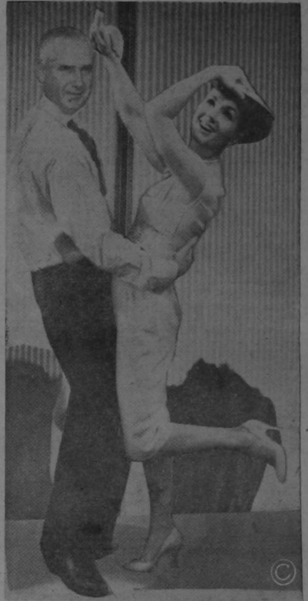
Yo abrazo únicamente a las mujeres en esta forma, y en otra que tengo patentada. Pero, bien que me gustaría ver a Oduber "abraSado".