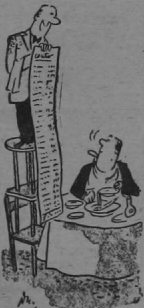
“Ha tenido el señor un apetito excelente.”

Rachmaninoff ha muerto. Cuando Stravinsky también ha ya muerto, probablemente le dedicaremos un gran homenaje.