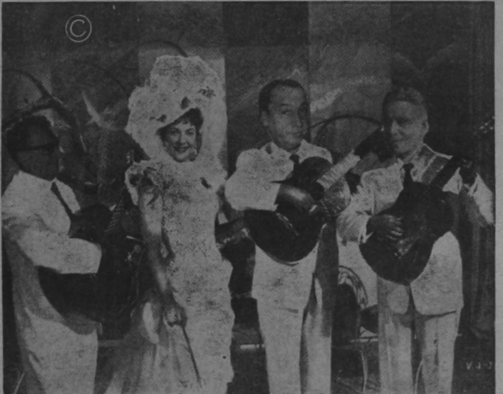
La popularísima canción afro-tica que tan encumbre de una de sus actuaciones, en que la moda ha puesto el Trío Políticos. Momento cantan a doña Presidencia 1961.