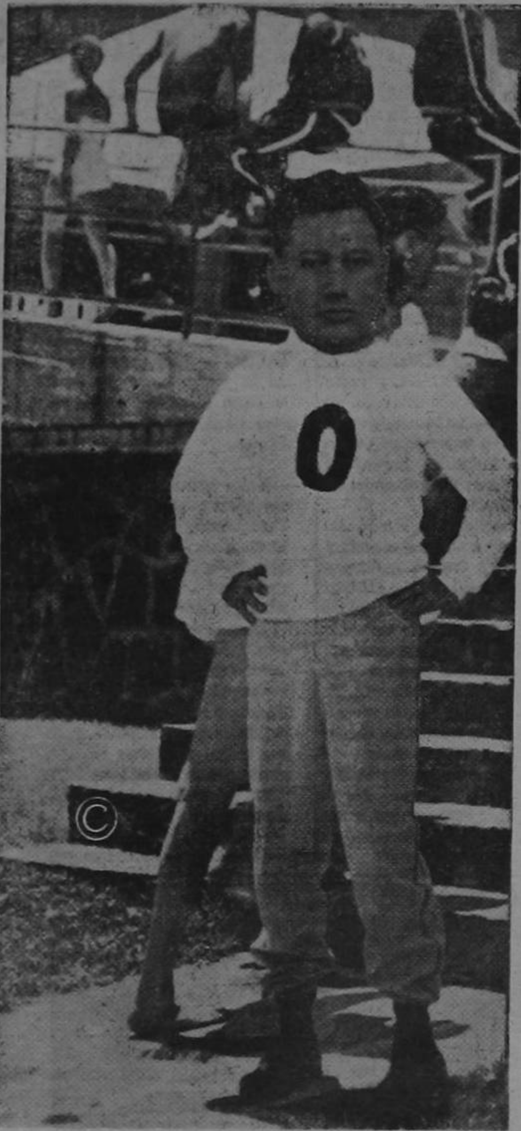
Juan Pancho Montealegre uno de los tatas del fútbol Tico, en pleno "peloteo" en el Estadio Nacional, donde lo vemos dirigiendo a la Selección Nacional que se "partirá el pecho" contra el cuadrado del Real Madrid, equipo que hasta la hora no ha actuado en nuestras canchas abiertas. Mucho Juan Pancho y duro con ellos... con los del Real y con los que no quieren que actúen en Tiquicia!