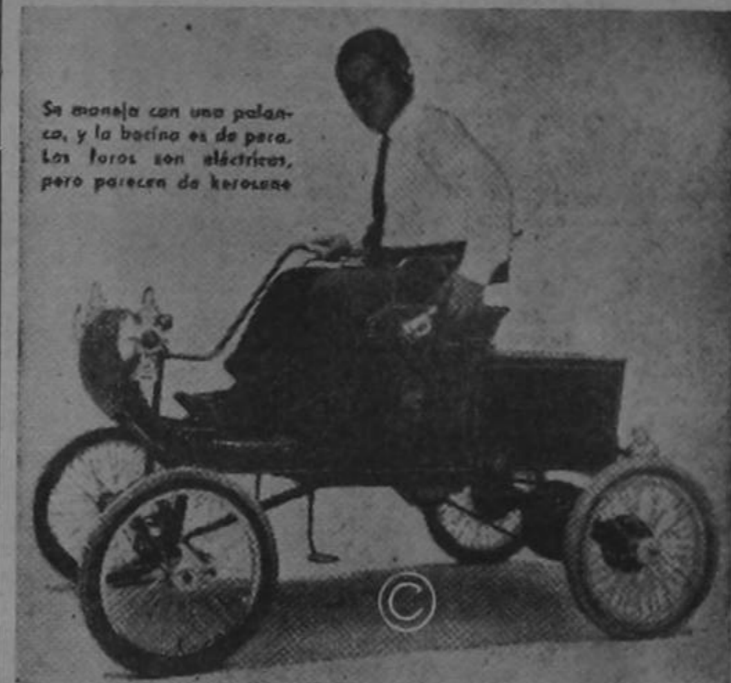
Se maneja con una palanca, y la bacinca es de para. Los toros son eléctricos, pero parecen de kerolane

La primera compañía en el país que se dedica íntegramente a importar y vender "latas" antiguas.