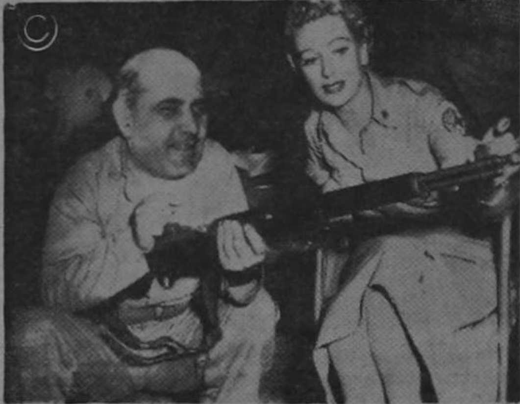
Captamos el momento en que nuestro Mandatario Presidencial, le enseñaba el manejo de un "tractorcito" a su secretaria de asuntos agrícolas... Con esa mecanización va a ser grande la cosecha de "palmitos"...