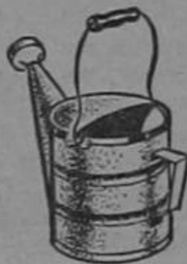
"CACTUS - KITT"

Distribuida en Costa Rica por: Motorina Gas & Co. Ltda.