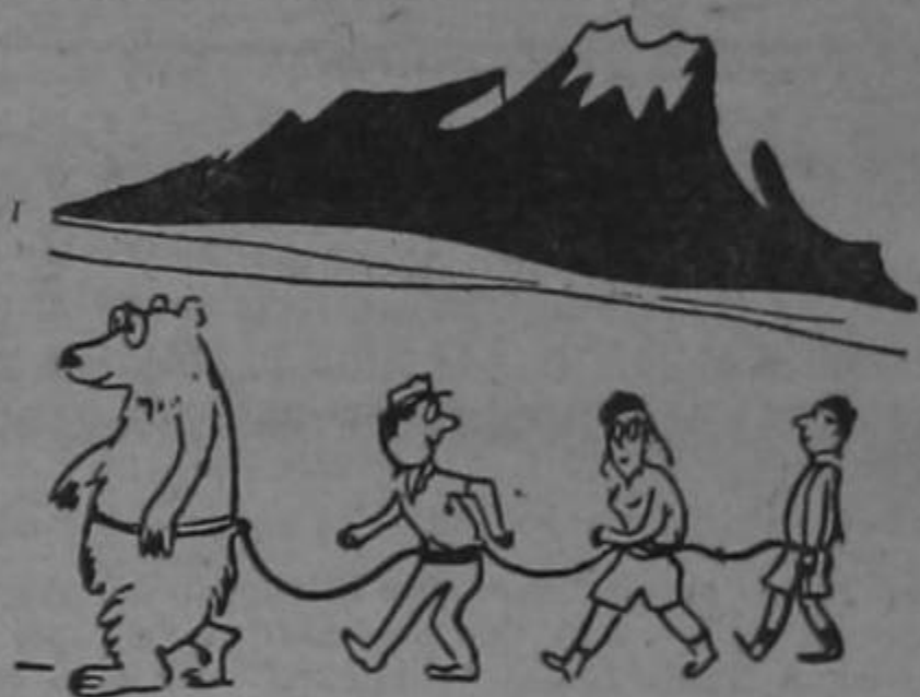
"Es el mejor guía de la región."

La Semana Cómica, lo saluda y si es del caso le daría la adhesión, rompiendo con nuestra tradicional apoliticidad... Vivan los Soleristas Unidos!!!