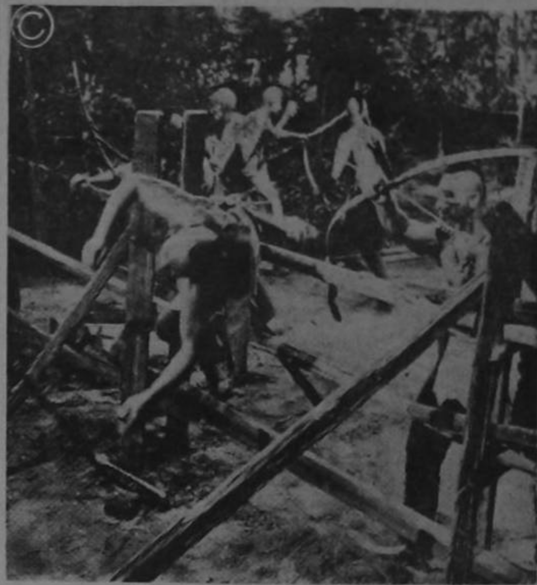
Telefoto desde Nueva York a La Semana Cómica. Momento crucial en que los "Indios" reciben una soberana paliza de manos de los "Angeles". Los sacaron de "home" y les hicieron 3 triple-plays... Nótese el Pitcher de los "Indios" a la derecha tratando de "lanzar" a segunda infructuosamente. Al Centro un bateador es puesto "out" con flechazo de short a tercera...