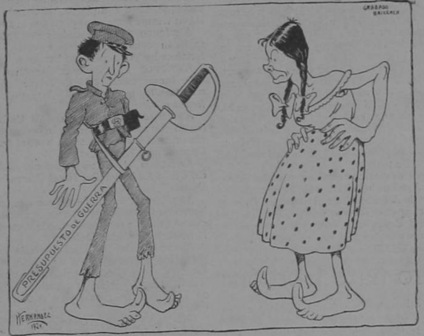
Con tan alto Presupuesto, venceremos a Inglaterra; habrá de temblar la tierra manteniéndonos en esto.

jer a Ud... Ya he protegido a muchos desde que llegué a este país.