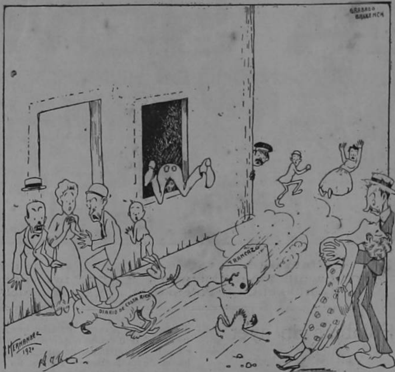
“El Diario” metiendo miedo con un invento famoso

El atún fino y macarelas, los ostiones, merluzas y caviar, que vende barato «LA INDIA».