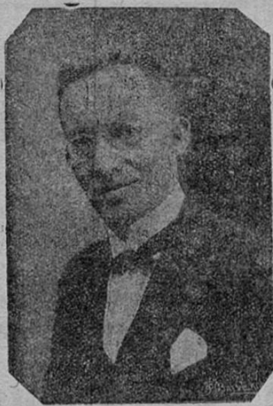
DR. REYES ARRIETA ROSSI, Ministro de Relaciones Exteriores