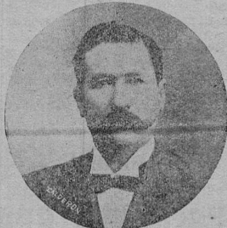
DOCTOR PIO ROMERO BOSQUE, Ministro de Guerra