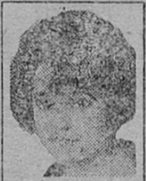
Favorita del Cine ALICE BRADY

Este es muy dañino pues deseca el cuero cabelludo, haciendo el cabello quebradizo. Puro aceite de coco Mulsified, el cual es puro e inofensivo, es mucho mejor que el jabón más costoso o cualquier otra cosa que pueda Ud. usar para el cabello.