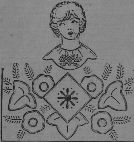
UN PRIMOROSO ADORNO DE "APPLIQUE"

Una vez un pedazo de papel carbón puede transferirse el diseño que aparece en el grabado a la tela en el centro de una alfombra o en la punta de una chalina. Todas las líneas deben transferirse con puntilla sencilla, los cuadros y círculo con puntilla de saín y para los puntos levase chaquiras de algún color.