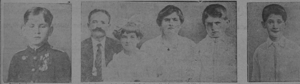
Apesadumbrada por la ausencia de haberse hecho idónea su hija mayor la cual constituía u-