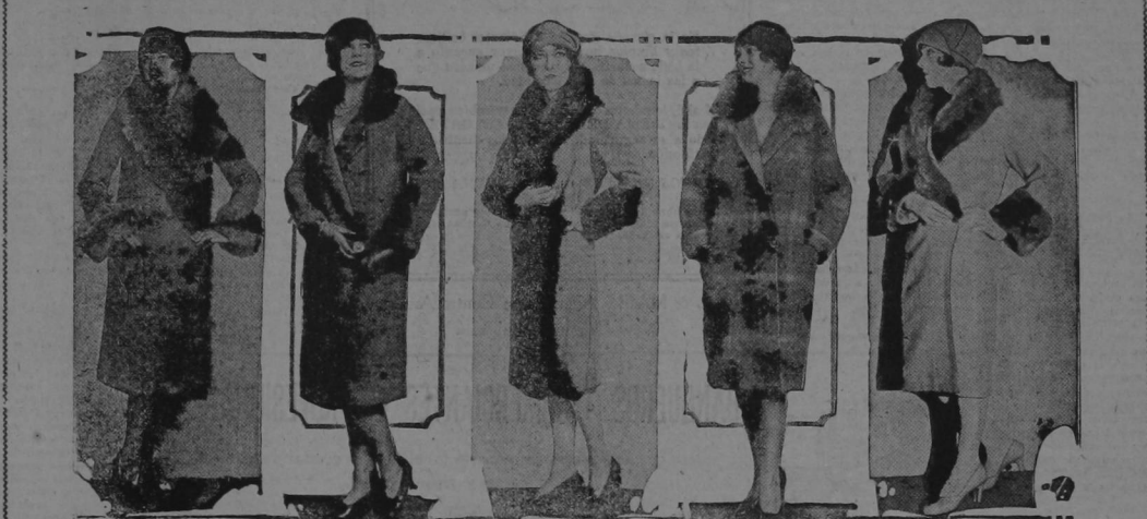
EL ABRIGO DE TELA es el favorito durante el invierno, según han decretado los modistos de París, y esa tiranía que todos acatan sin protestar, prefiere material de pelo de camello y otras telas que a la par que dan calor, son livianas y atractivas. Mostramos aquí cinco bellos