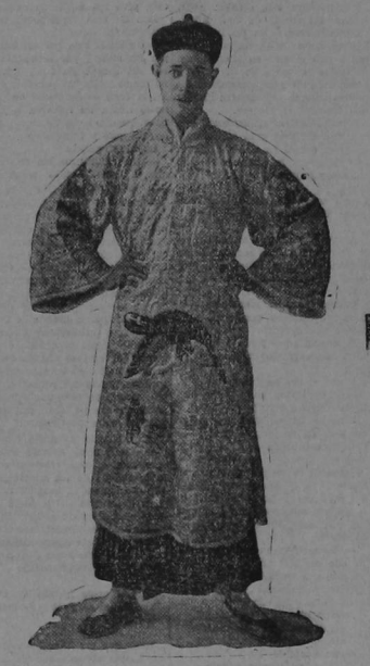
El famoso ilusionista y mago Hing, Li - Ho - Chang, notable artista que mañana hará su presentación desde el escenario del América

EL FAMOSO CHINO LLEGA PRECEDIDO DE GRAN FAMA