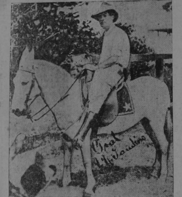
GENERAL AUGUSTO C. SANDINO, jefe de los patriotas que están luchando desesperadamente por ver a su patria libre de la opresión del invasor extranjero que está hollando su dignidad y soberanía de pueblo libre. Sandino es el único general que rehusó aceptar el arreglo yanqui.

De NUEVA YORK. En un editorial publicado por el Wall Street Journal, se asegura que el "Times" considera las pérdidas de vias a mercaderías en Nicaragua debidas exclusivamente a la mala suerte. Sin embargo, nunca el "World" ha estado tan bien dispuesto hacia la política exterior de las administraciones republicanas, ya que considera como el resultado de una larga serie de equivocaciones.