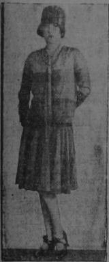
TRES Matices de color azul, efectivamente combinados, tiene este bonito traje de calle que lo es la bellísima artista del cine...