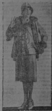
ESTHER RALSTON, simpática artista mostranos en ésta pose un bello modelo de traje propio para salir de paseo...