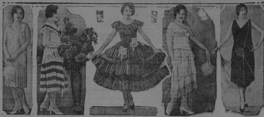
MOSTRAMOS aquí a nuestras bellas lectoras cinco elegantes modelos de trajes de noche, apropiados para la recepción, el baile, sea éste de confianza o etique...