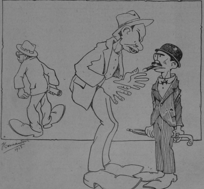
—TIENE RAZON EL GENERAL AL QUE MAS DESVELO Y SUDORES LE HAYA COSTADO LA CAMPANA DEBE DARSELE LA PRIMERA DESIGNATURA.