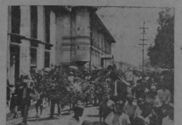
A la cabeza del desfile hacia el Cementerio, manos amigas y piadosas portaban diversas y hermosas ofrendas florales que imprimían al acto gran solemnidad