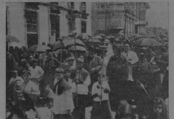
Los señores Obispos Monestel y Volio seguidos de otros distinguidos elementos del Clero y del Público, inician el importante desfile hacia el Cementerio

que un tren de romeros, tratando el planible intento que iba camino de su realización. Y las aguas volcánicas y cristalinas del Virilla se llevaron de párpura; y del hecho de aquel paraje sonó, surgieron ayer, gemidos; la fatalidad reía trágicamente en las profundidades. El dolor se entornó, y sus garfios de exterminio y de tristeza cifraron en numerosos hogares y corazonas; la mayoría alajuelenses— llevando el luto y la desesperación a todos ellos.