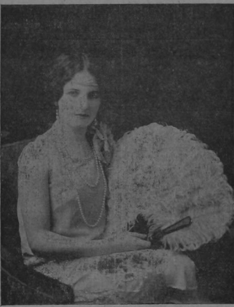
ST. MARTA RODRIGUEZ