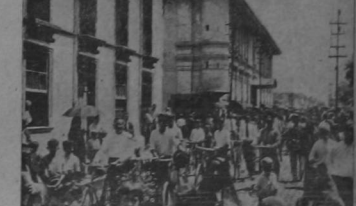
Gran número de ciclistas concurrió también a la majestuosa ceremonia, testimoniando con su presencia su simpatía hacia los que sucumbieron en la horrosa tragedia