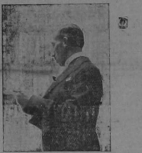
El señor Cónsul de España en momentos de pronunciar su sentido discurso fúnebre alusivo al acto