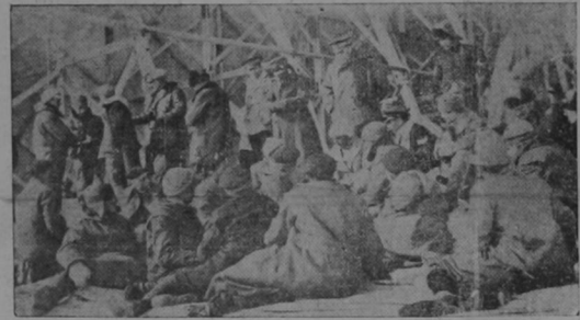
Esta foto que aquí mostramos fué la última que se tomó de la intrépida trifulación ártica cuya suerte ha conmovido al mundo.