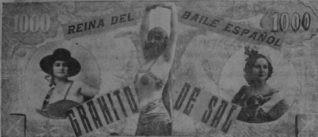
REINA DEL BAILE ESPAÑOL

ESTRENO DE LA GRANDIOSA PELICULA "EL AMOR VELA"