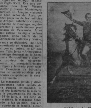
El Libertador Simón Bolívar

El viejo canónigo se dirigió al señor de Brest, con la tierra contra el de su fisonomía angelical le dijo: —No le apures por la comedia, Juan Vicente, que no es la guía el pecado que me ha llevado al infierno. —Sí, como que apenas pruebas bocado y veinte veces ya le hemos dicho que has de caer en coma con tantas privaciones observó la marquesa, estrechando amigablemente la mano de su primo el canónigo.