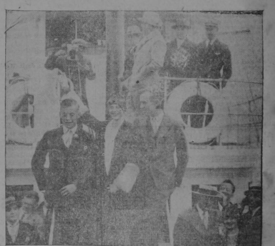
Al son de las sirenas en los innumerables barcos en el puerto de Nueva York, fueron recibidos con entusiasta algabala, la sportista Emilia Hearhart, primera mujer que cruzó el Atlántico en aeroplano, y sus dos compañeros, Wilmer Stultze y Lew Gordon. Los tres se ven en primer término en esta foto.