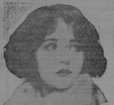
Betty Compson, famosa actriz cinematográfica, al notar la desaparición misteriosa de su madre, empleó detectives privados para localizarla y la encontraron recluida voluntariamente en una casa de pobres. La artista, que es rica, se opuso a ello y se llevó a su palacial morada a la autora de sus días. ¡Chocóla, Betty!