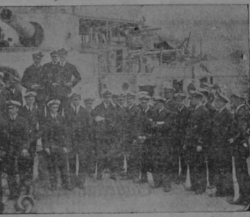
Más de trescientas personas se encuentran en el transporte de guerra chileno "Angamos", chocó contra las rocas de Punta Chimal. Sólo cuatro personas sobrevivió a la catástrofe. El barco no sólo llevaba reclutas del ejército, sino que también un número de pasajeros. Esta foto nos muestra el grupo de la oficialidad del infortunado "Angamos".

noche el vapor "Tarapacá" interceptó mensajes inalámbricos del "Angamos" diciendo que el transporte se hallaba en situación sumamente difícil. El mensaje no daba la situación exacta del "Angamos" creyéndose que fue transmitido con un pequeño aparato