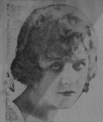
Wanda Hawley, rubicunda y bella actriz de la pantalla, que ha sufrido un serio ataque de apendicitis en su palacial residencia de Hollywood, siendo necesario someterla a una operación quirúrgica para salvar su preciosa vida.