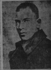
Max Valier, inventor de Miroch, quien intenta elevarse, más allá de la atmósfera terrestre, usando un aeroplano basado en el principio del cohete volador.

Aspiro a ser el primero en intentar el sistema. Si el objeto elevarme far el sistema. Si logro elevarme con facilidad lo que viene después será más fácil. Se creará en mi idea y no es raro que se apresure un apoyo que hasta aquí ha venido siendo tan restrictivo. Estas razones inducen al determinación de apresurar a toda costa mi primer intento de volar con una pequeña máquina, provista de una traca de descarga, por más sencilla.