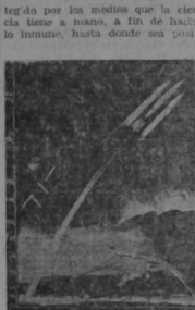
El avión transatlántico del futuro, provisto de cohete de propulsión, abandonando su vuelo normal, tal como lo imagina Max Valier.

El piloto sería artificialmente protegido por los métodos que la ciencia tiene a mano, a fin de hacer lo inhumano, hasta donde sea posible, a las condiciones atmosféricas ya previstas, o a aquellas desconocidas que se investigaran.