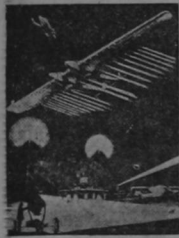
Dibujo concebido por Max Valier que exhibe la supervisión de las alturas adquiridas por los aparatos de aeromarcación... 6 millas 7 para el balón... 37 millas 2 para un aeroplano... 43 millas 4 para un proyectil cohete... 155.2 para el avión proyectil del futuro.

Las teorías se bacían en las pruebas del "Automóvil-Cohete". Pudiéramos alcanzar la luna? Se burlará el hombre de las leyes de la inercia?