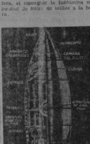
El llamado "buque del espacio" exhibiendo el arreglo de sus compartimentos mecánicos y la cabina y cámara del piloto.

Las enormes extensiones oceánicas demandan hoy maquinaria de más altas capacidades. De este modo, ni idea del avión-cohete es el único vehículo aéreo que se impondrá en el futuro. Todavía me es imposible, a veces de cualquiera extensión y él hará lo posible que se dominen alturas hasta ahora inabarcables, que torben un nuevo espacio el cruceamiento de las rutas