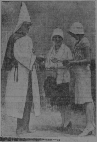
El Senador Helkin, archienemigo del candidato presidencial Smith en Norteamérica, no se presentó a una gran reunión que el Klu Klux Klan celebró el día 4 de julio. Aquí vemos a un oficial de la mencionada sociedad cobrando la entrada a dos Sritas.