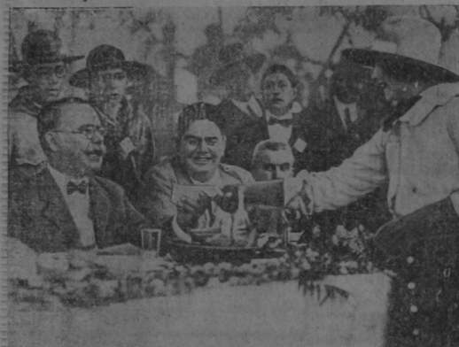
Esta foto nos muestra al General Alvaro Obregón, Presidente electo de México, recibiendo la felicitación que le da una bella compatriota, en el restaurant La Bombilla, momentos antes de ser asesinado.