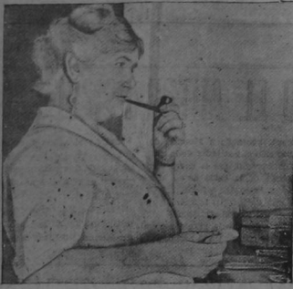
Camilla Grumo, renombrada actriz que actualmente conquista aplausos en los escenarios norteamericanos. Camilla cosa lo ideal cuando aspira el pungente humo de su apacible pipa durante los entreactos en su camerita. ¡Y desde luego en su casa también! Así la vida es un sueño!