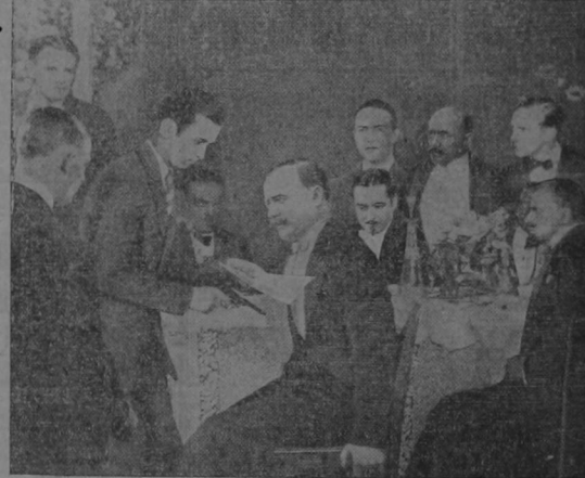
Ultima fotografía del General Alvaro Obregón, Presidente electo de México, quien falleció instantáneamente a manos de José Juan González, quien le disparó cinco tiros a quemarropa mientras se celebraba un banquete en su honor en el restaurant "La Bombilla", en la Capital de la República Azteca.