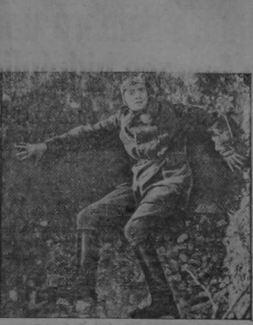
-Los aviones tomaron sus disparos hacia el-